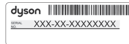
Immagine a scopo puramente illustrativo.

Il numero di serie si trova nell'angolo inferiore destro della contropiastra, sul modulo di registrazione all'interno della confezione e sul grande adesivo informativo presente intorno al rubinetto una volta disimballata l'unità.